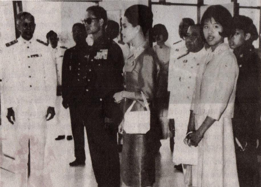
เสด็จพระราชดำเนินเยี่ยมชมวิทยาลัยที่ 1 ( อาคารคณะรัฐศาสตร์และรัฐประศาสนศาสตร์ในปัจจุบัน ) ซึ่งขณะนั้นเป็นอาคารหอพัก และเป็นสถานที่ทำกิจกรรมของนักศึกษา

“เวลานี้ เรากำลังต้องการคนดีที่มีปัญญาและมีความรอบรู้ในด้านต่างๆ มาเป็นกำลังทะนุบำรุงบ้านเมืองเป็นจำนวนมาก และยิ่งจะต้องการเพิ่มมากขึ้นอีกเป็นลำดับในวันข้างหน้า เพราะ