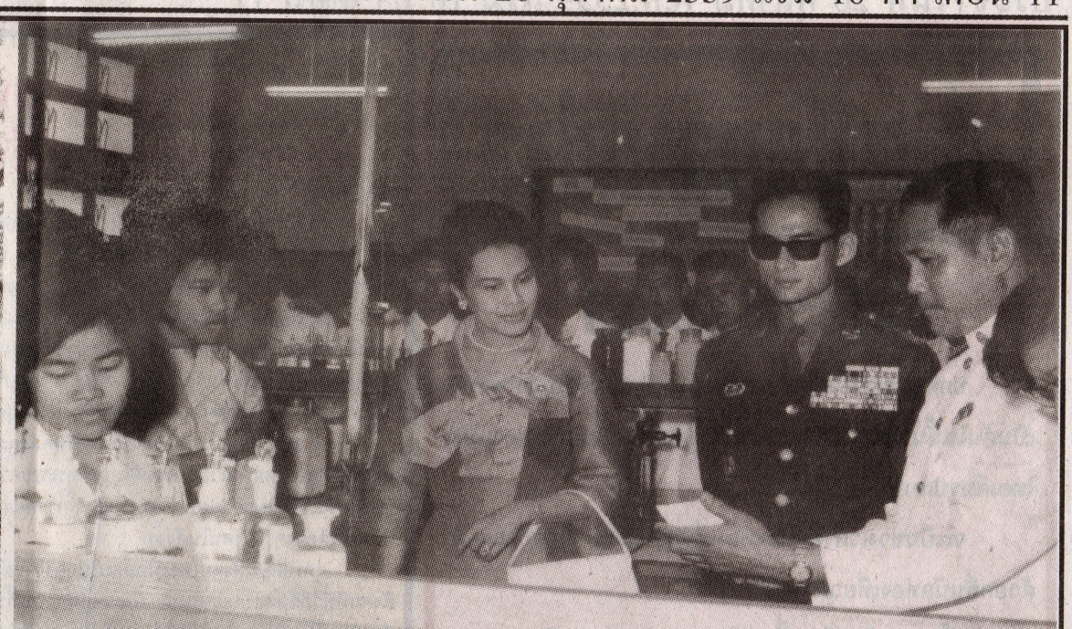
เสด็จพระราชดำเนินเยี่ยมชมกิจการในส่วนการเรียนการสอนของมหาวิทยาลัยเชียงใหม่ ณ ตึกเคมี คณะวิทยาศาสตร์ ซึ่งเป็นอาคารเรียนหลังแรกของมหาวิทยาลัยเชียงใหม่