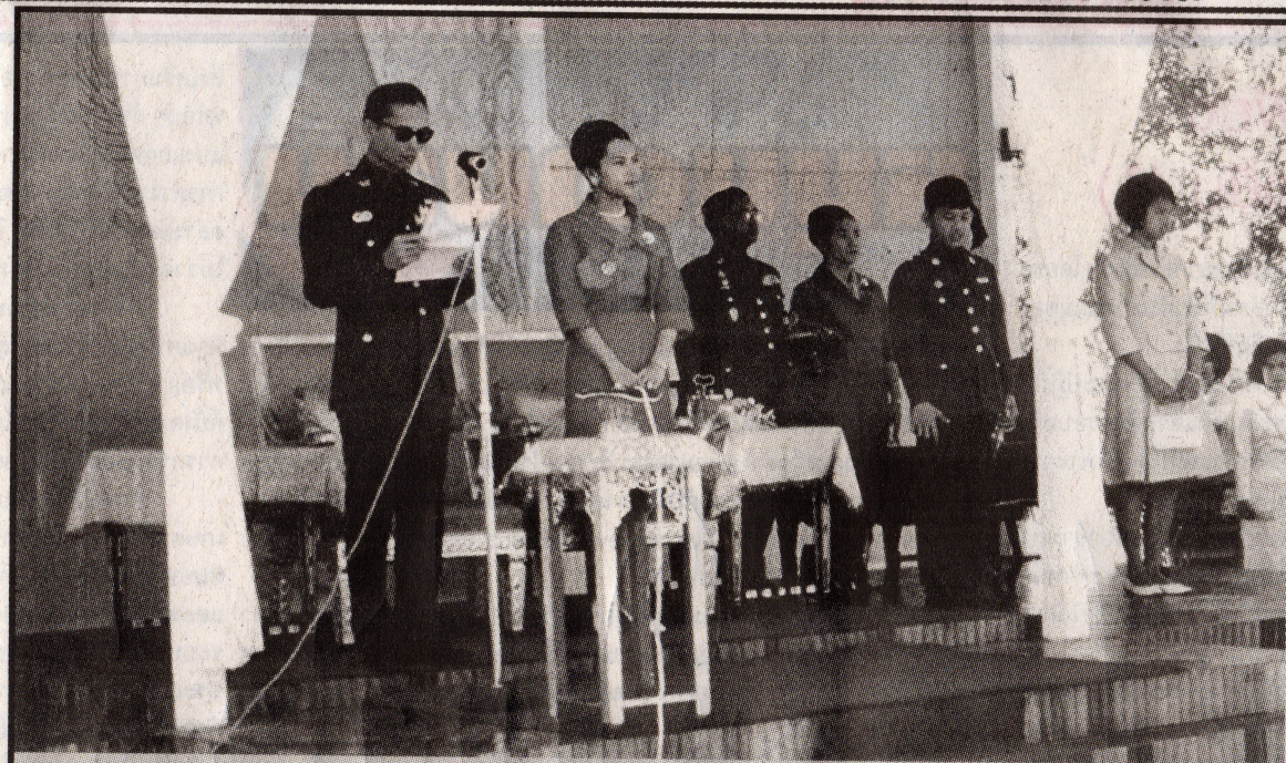
พระบาทสมเด็จพระเจ้าอยู่หัว และสมเด็จพระนางเจ้า พระบรมราชินีนาถ เสด็จพระราชดำเนินพร้อมด้วย สมเด็จพระเจ้าลูกเธอ เจ้าฟ้าอุบลรัตน์ราชกัญญาฯ และสมเด็จพระเจ้าลูกยาเธอเจ้าฟ้าวชิราลงกรณาฯ ทรง ประกอบพิธีเปิดมหาวิทยาลัยเชียงใหม่เป็นทางการ