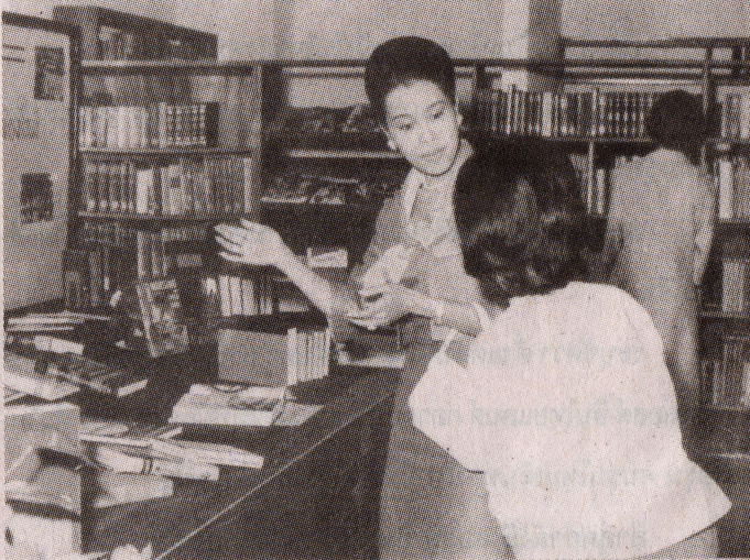
เสด็จพระราชดำเนินเยี่ยมชมห้องสมุดมหาวิทยาลัยเชียงใหม่ซึ่งขณะนั้นเปิดให้บริการ ณ ตึกเคมี คณะวิทยาศาสตร์

วิชาการ โดยยึดมั่นในศีลธรรมและคุณธรรม เพื่อความเป็นเลิศทางวิชาการ การประยุกต์ เผยแพร่และการทำนุบำรุงศิลปวัฒนธรรม บัณฑิตแห่งมหาวิทยาลัยเชียงใหม่ พึงฝึกฝนในการฝึกฝนตน เป็นผู้รู้จริง คิดเป็น ปฏิบัติได้ สามารถครองตน ครองคน ครองงาน ด้วยมโนธรรมและจิตสำนึกต่อสังคม”